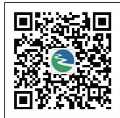
路桥农商银行视频号