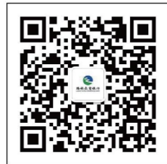
路桥农商银行公众号