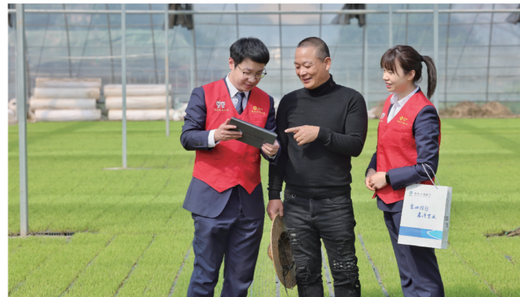
图为蓬街支行客户经理在了解客户需求

农为邦本，本固邦宁。我行聚焦农户“急难愁盼”，以“红色数智金融助富大脑”搭建智慧化服务平台，以“共富家庭数贷”打造造富“数智引擎”，着力解决农户融资难题。