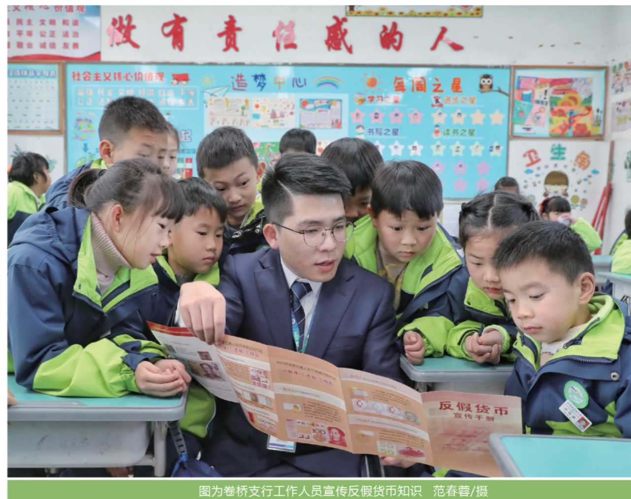
图为卷桥支行工作人员宣传反假货币知识

► 我行始终坚持“百路千桥 家喻户晓”目标方向，擦亮服务底色，争当百姓身边的最美金融百晓生，打造百姓身边暖心、快办的首选银行。