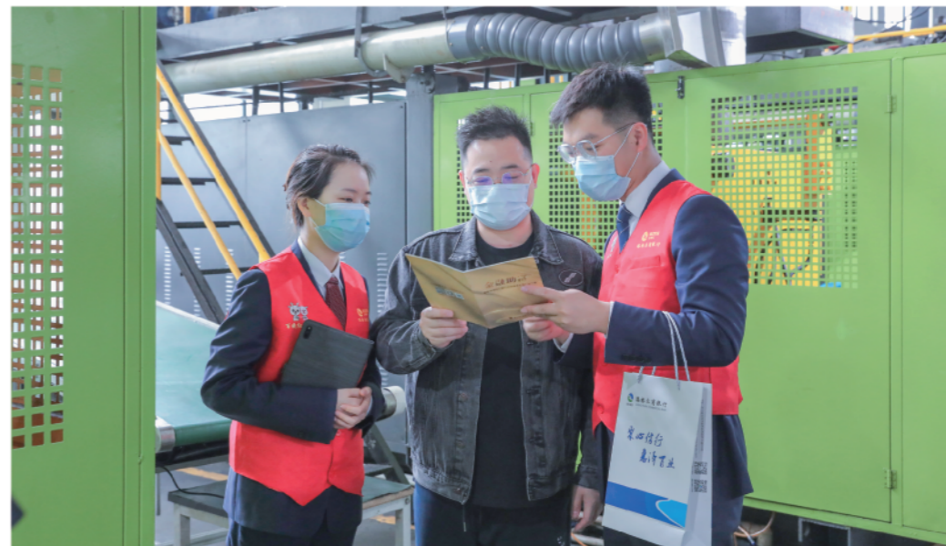
图为蓬街支行金融百晓在介绍共富产品